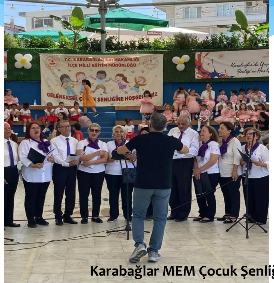
Karabağlar MEM Çocuk Şenliği