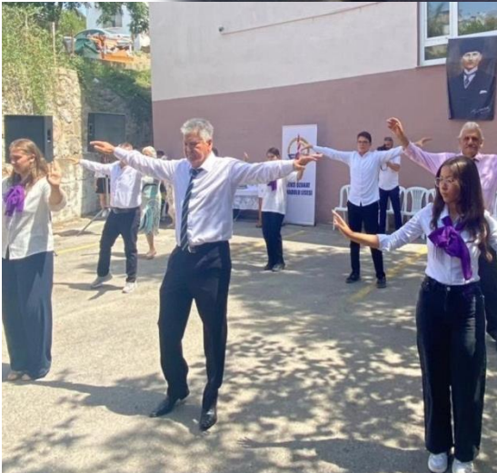
K3Yü Mezuniyet Töreni Halk Oyunları Ekibi Prova ve Gösterisi