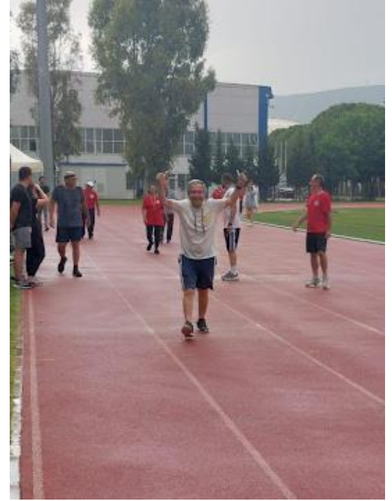
I. Spor Şenliđi