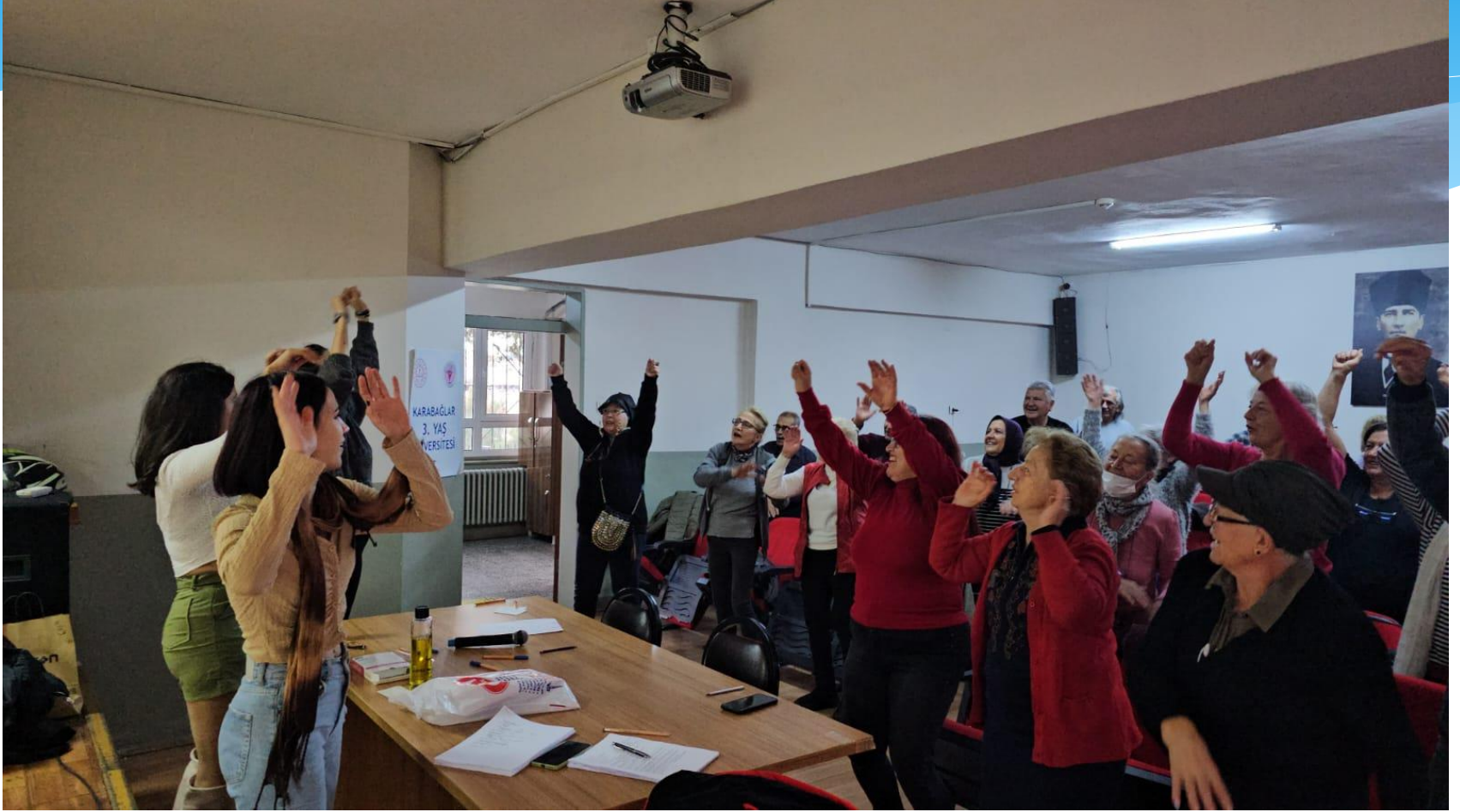
Kahakaha Yogası Dersi