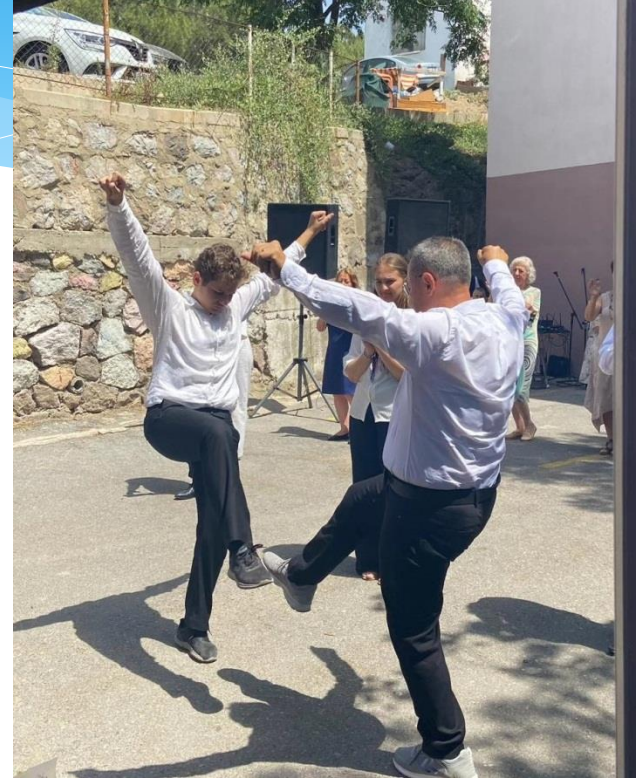
K3Yü Mezuniyet Töreni Halk Oyunları Gösterisi