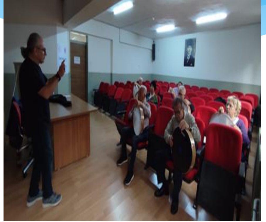
Psikodrama, Bendir Dersleri