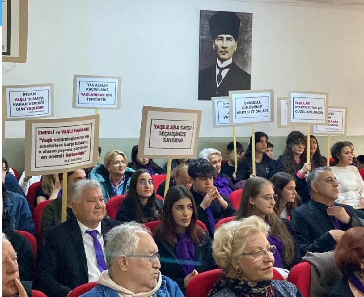
3YÜ Bahar Dönemi Açılışı ve Yaşlılar Haftası