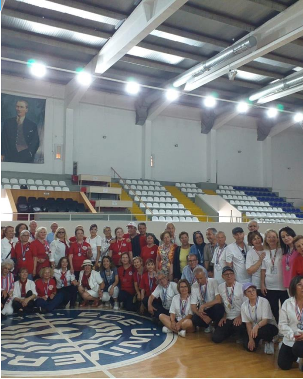
Ege 3. Yaş I. Spor Şenliği