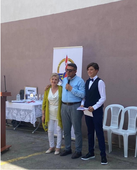
Karabağlar İlçe MEM Müdürü, K3YÜ Mezuniyet Töreni sunucuları ile