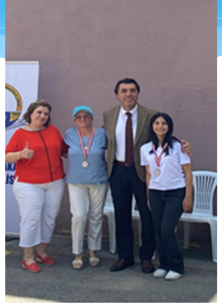
Akıl-Zeka Oyunları Turnuvası