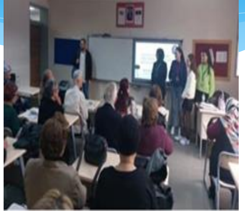
Sağlıklı Yaşlanma Dersleri