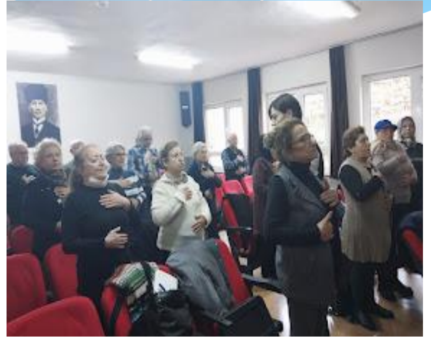
Kahkaha Yogası Dersleri